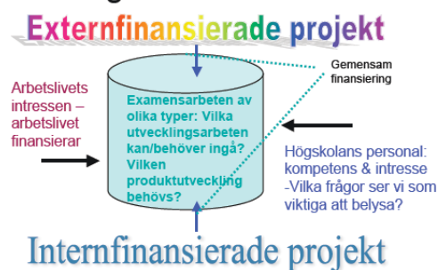
Figur 1: Samverkan för utvecklingen av möjliga projekt.

Vidare belystes en central aspekt av handledningsarbetet vid inledningen av ett examensarbete: att skilja mellan det breda område examensarbetet handlar om, vikten av avgränsning, vilket sker genom formuleringen av syftet med examensarbetet och slutligen preciseringen i en eller några frågor som examensarbetet ska belysa. Frågan om det som lärarna uppfattade som vetenskaplighet problematiserades. Istället lyftes ett kvalitetskriterium som gäller utvecklingsarbeten generellt: att de ska präglas av systematik och var skrivna på ett sätt som gör det möjligt för läsaren att förstå vad som gjorts, hur arbetet genomförts, vilka yrkesmässiga motiveringar som legat till grund och vilka slutsatser man kan dra utifrån arbetet.