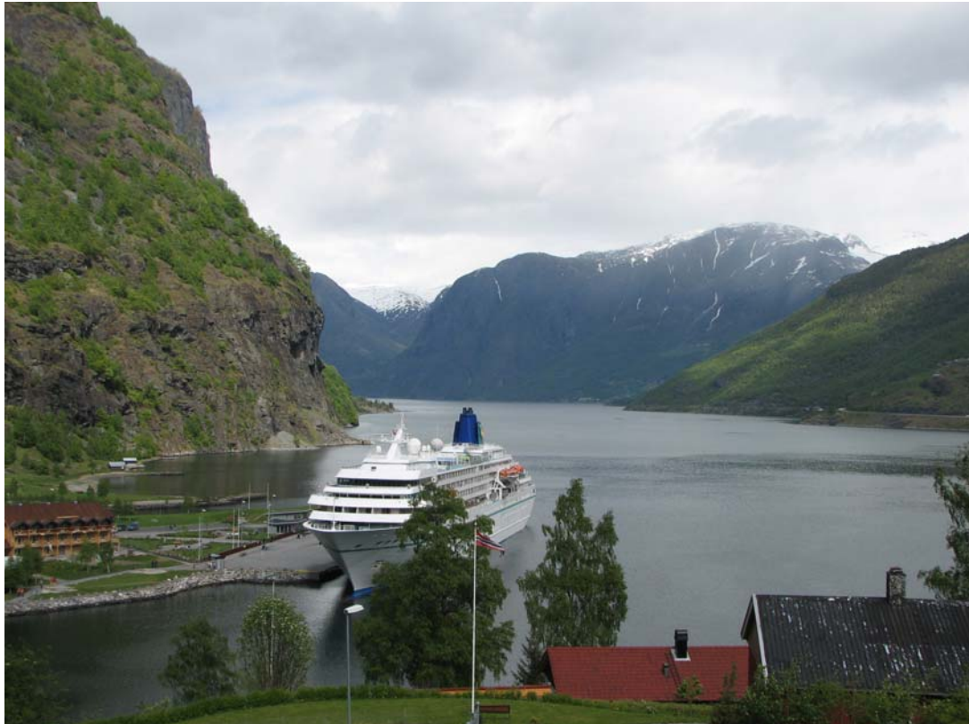
Flåm – Sognefjord