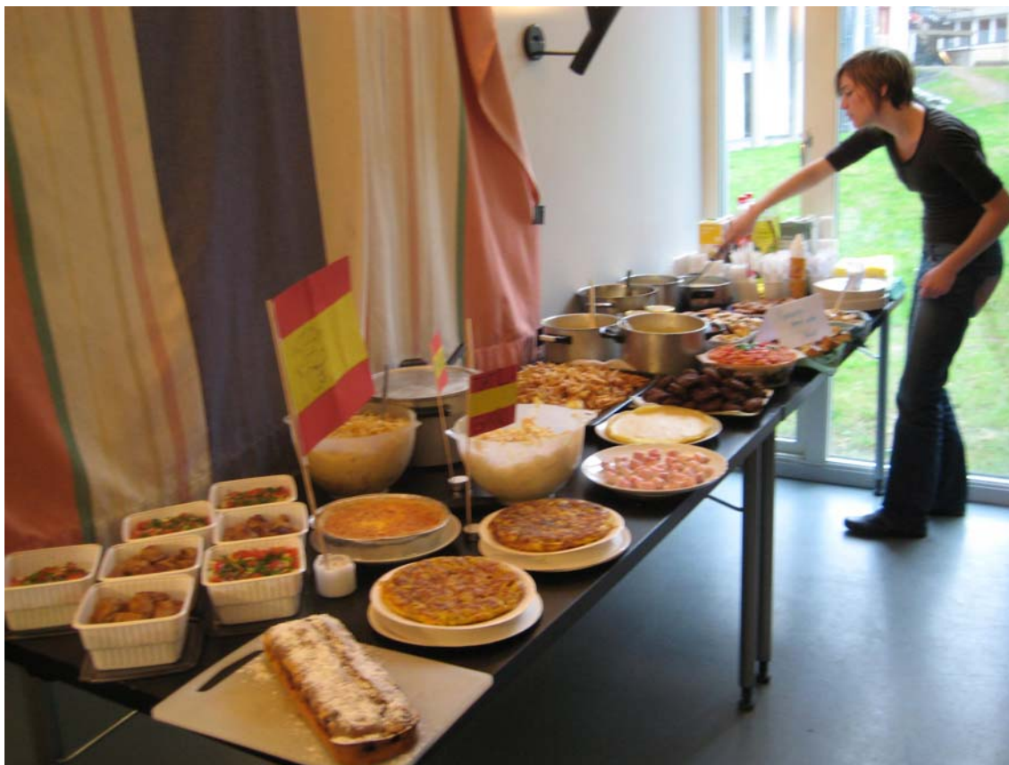
International Food Day

Högskolan i Oslo har ett internationellt kontor som tar hand om att ordna bostad för de utbytestuderande som kommer, informera de utländska studerande om praktiska saker som de måste veta när de anländer i Norge, hjälper med information om registrering, skattekort och dylikt. Det internationella kontoret, tillsammans med Internationella Studenters Organisation (ISU- International Student's Union- i vilken jag var viceordförande under våren 2008) ordnar kulturella och sociala aktiviteter för de utländska studerande. Nästan varje fredag besökte vi museer, Kulturella center eller gick på tur i Oslos område. Högskolan stod för transport och entré kostnaderna. Dessa utflykter och museibesök var mycket uppskattade av studerande. På tisdagar ordnades ett Internationellt Café på Samfunnet, studenternas festlokal, där tittade vi på film, spelade ibland Guitar Hero och andra spel, drack kaffe eller te, och väldigt ofta lagade någon från Internationella kontoret våfflor, någonting som nordmän älskar att äta. ISU ordnade också "hytte tur", resa till Köpenhamn, curling spel och en del fester med olika tema, exempelvis Karaoke Kväll, Salsa Party, Bad Taste Party och också en Internationell Mat Dag där studerande lagade mat från deras hemländers cuisine och den som ville fick smaka på den.