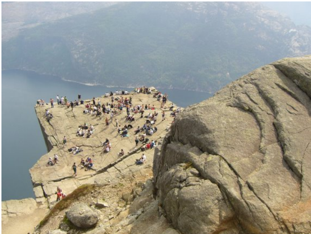
Preikestolen – Lysefjord