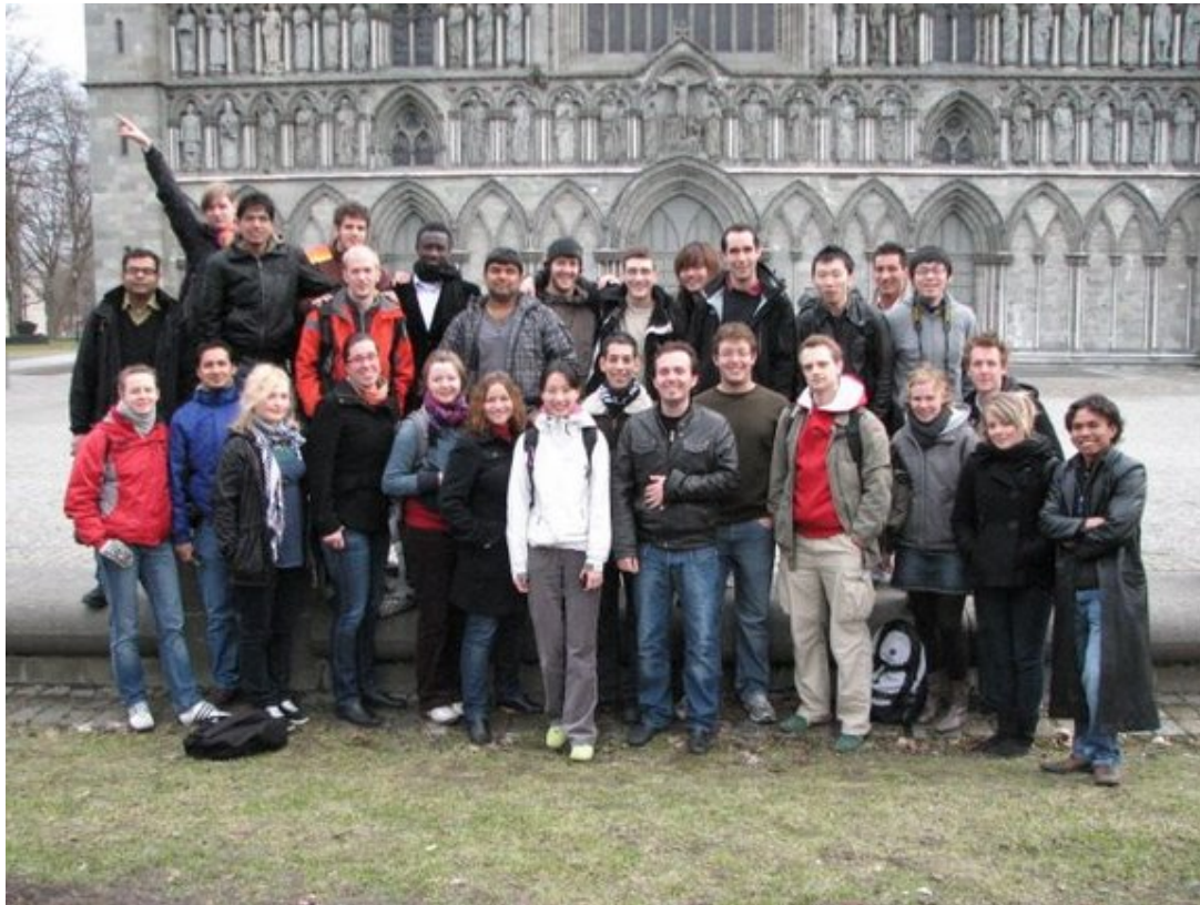
International Student's Union – National Assembly, Trondheim