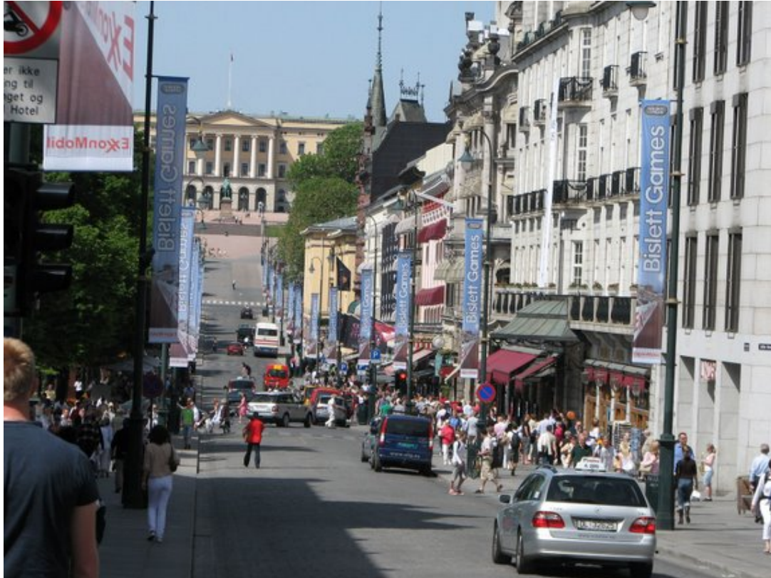
Karl Johan mot Slottet