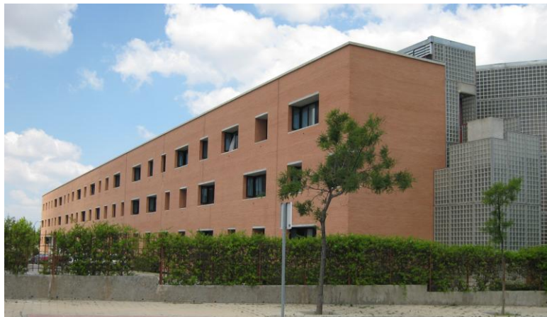
Studenthemmet i Leganés där jag bodde

För de som är intresserade, kan jag berätta lite kort om några av bibliotekets projekt som inte enbart berör biblioteket.