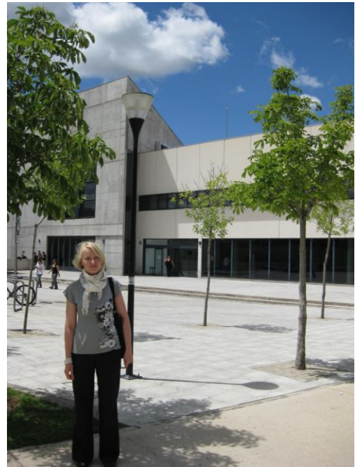
Utanför biblioteket i Colmenarejo

Interiör från biblioteket i Getafe. Våning 2 med kurslitteraturen. Där köpte man in kursböcker enligt följande princip: under 100 studerande = 2 ex över 100 st. = 3 el 4 ex över 300 st. = 4 el 6 ex osv 800 studerande = 12 ex