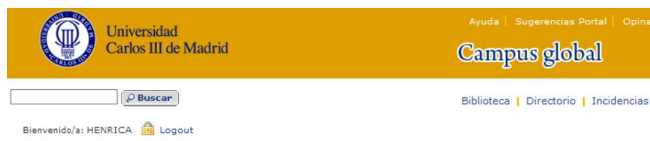
Intranätet, som heter "campus global"

Webbsidan är uppdelad i två delar, den publika webbsidan som är öppen för alla och intranätet som kräver inloggning. Den publika webbsidans viktigaste målgrupp är framtida studenter och forskare.