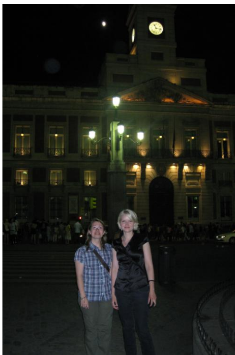
Biblioteket i Leganés