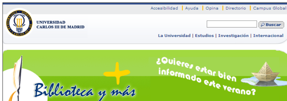
Bibliotekets sidhuvud, som inte gjorts om ännu och följer den tidigare idén om att attrahera en yngre målgrupp/framtida studenter