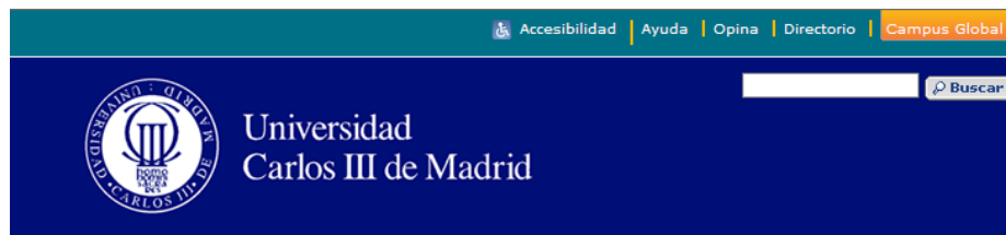
Nuvarande sidhuvudet på universitetets webbsida

viktigast (forskare från andra länder och utbytesstudenter), och därför har webbsidan nu mer seriös design. På bibliotekets webbplats kan man fortfarande se hur den ungdomligare stilen kunde se ut.