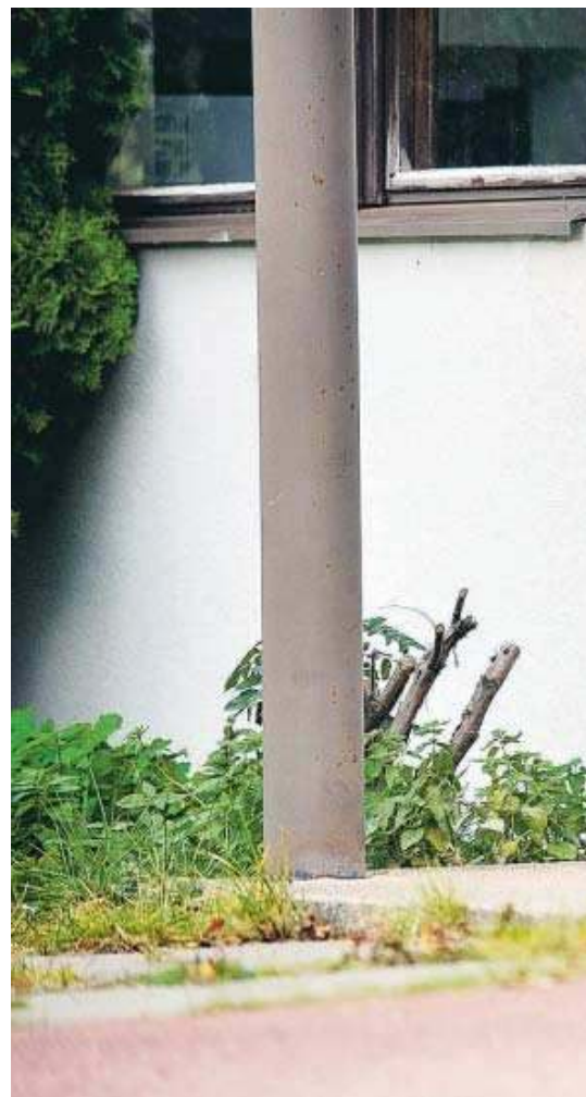
STORA SPRICKOR Sedan 1997 har 70-talshuset i centrala Mariehamn konti-

orna. 1999 har Ålands ömsesidiga försäkringsbolag med långa tänder betalat ut ersättning för reparationer på huset. Varken försäkringsbolaget eller staden trodde att grävningens arbeten hade påverkat sprickorna utan trodde på sättning.