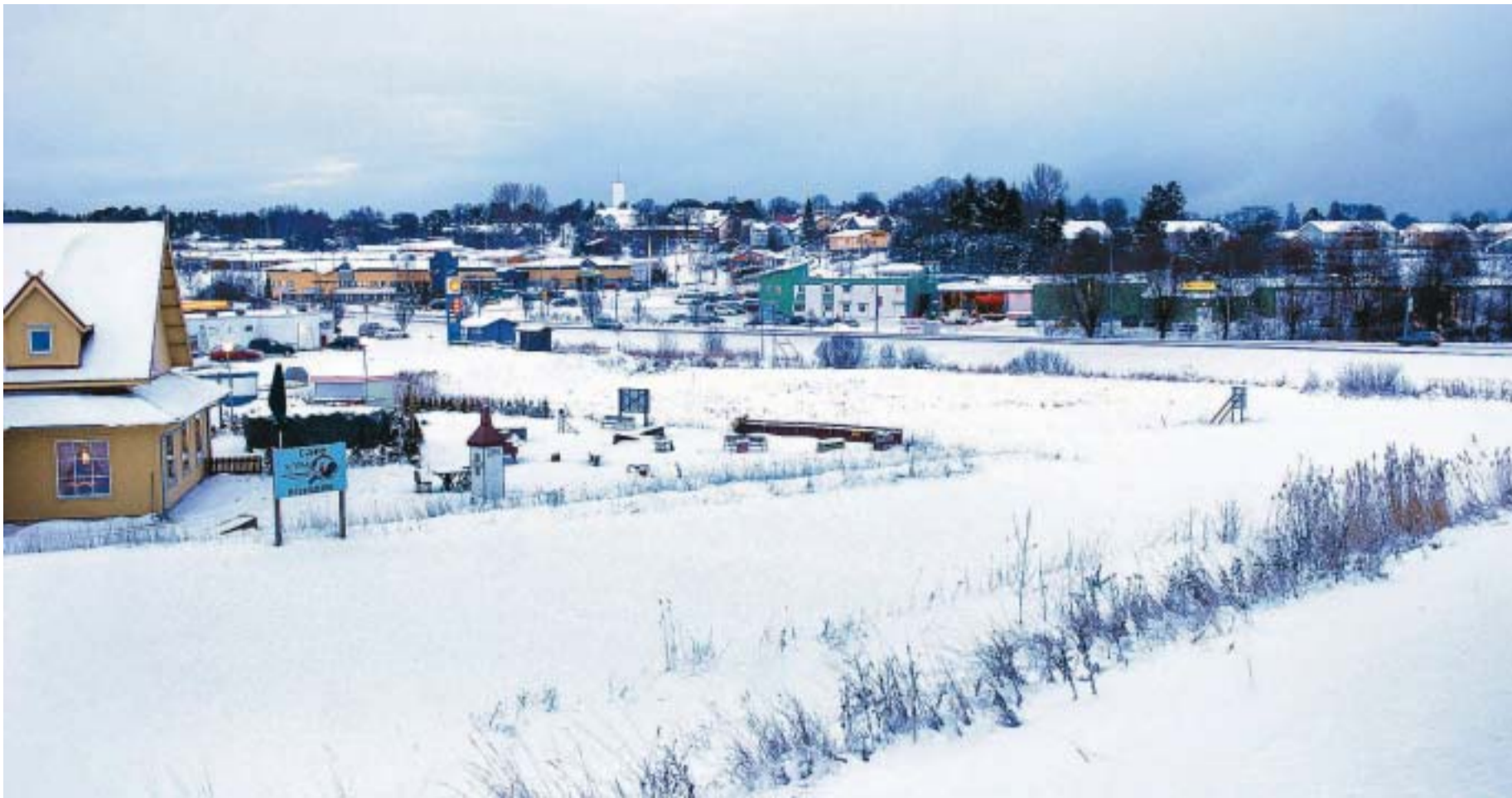
VINST Gard fastigheter gör en vinst på 25.000 euro då man efter tre år säljer tomten i centrala Godby. Ny ägare är nyregistrerade företaget Fastighets ab Godby Plaza som ännu inte vill avslöja sina planer för tomten.