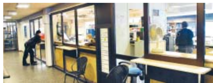
TULLEN Bland annat förtullning av arbetsmaskiner och varor vid tillfällig införsel diskuterades vid finansministermötet.

–Användningen av sociala medier för att få information om kandidater verkar fortfarande inte vara så stor bland ålänningarna, konstaterar gruppen. (mt)