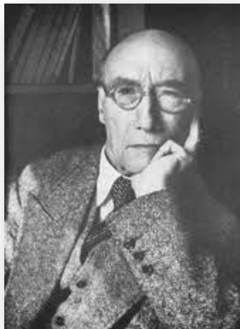
André Gide (22.11.1869 – 19.2.1951)