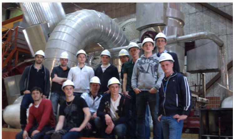
Högskolans fjärde års maskinteknikstuderande vid ångturbin 270 MW vid Värtaverken i Stockholm.

Besöket avslutades med en rundtur i en gammal, ur drift tagen gasklocka. En stor cirkulär tegelbyggnad, helt tom inuti. Man funderar som bäst på vad den ska användas till. Ett förslag är att den skall göras om till opera. En imponerande byggnad.