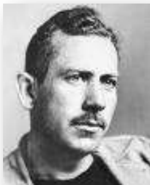
John Steinbeck (27.2.2002 – 20.12.1968)

Förmågan att i dag tänka annorlunda än i går skiljer den vise från den envise.