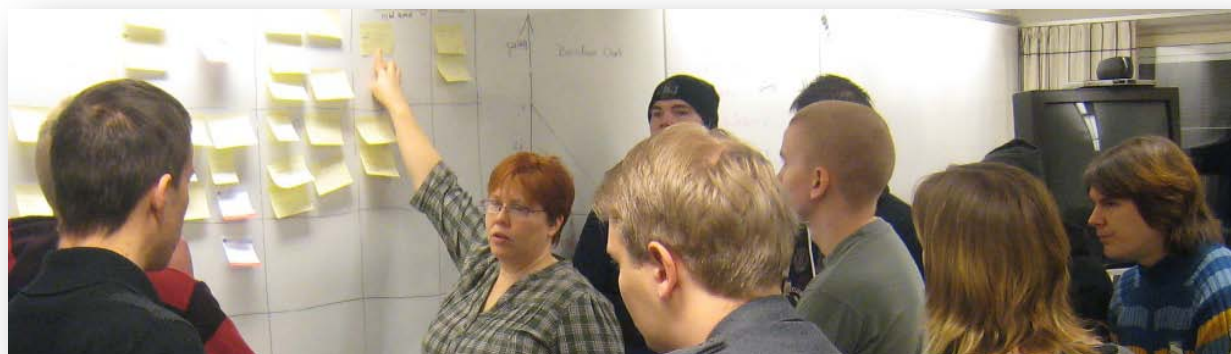
Team Gotland in action