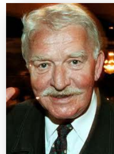
Hasse Alfredson (28.6.1931 –)

"Om allting är för jäkligt måste man ändå vara glad, för det är ens skyldighet att inte öka världens sorg."