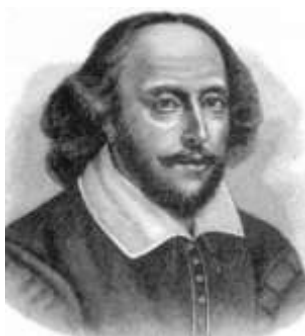
William Shakespeare (23.4.1564 – 23.4.1616)

"Lyckan är en parfym du inte kan stänka på andra utan att själv få några droppar på dig."