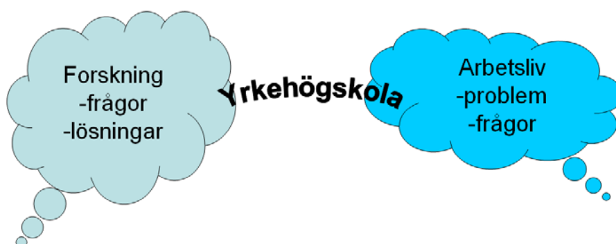
Figur 1. Yrkeshögskolan – tänkt som bro mellan arbetslivet och forskningen

Exempel på de nya krav som ställdes på yrkeshögskolorna var att de skulle bidra till utvecklingen av det regionala arbetslivet (figur 1). Därför förväntas studerande som går en yrkeshögskoleutbildning lära sig söka, välja och använda forskningsresultat. Vidare förväntas de, under sin utbildning, utveckla kontakter till det lokala arbetslivet. Kombinationen av kännedom om forskning inom professionsområdet och det lokala arbetslivets behov har setts som de grunder som behövs för att studerande ska kunna bidra till den lokala/regionala utvecklingen.